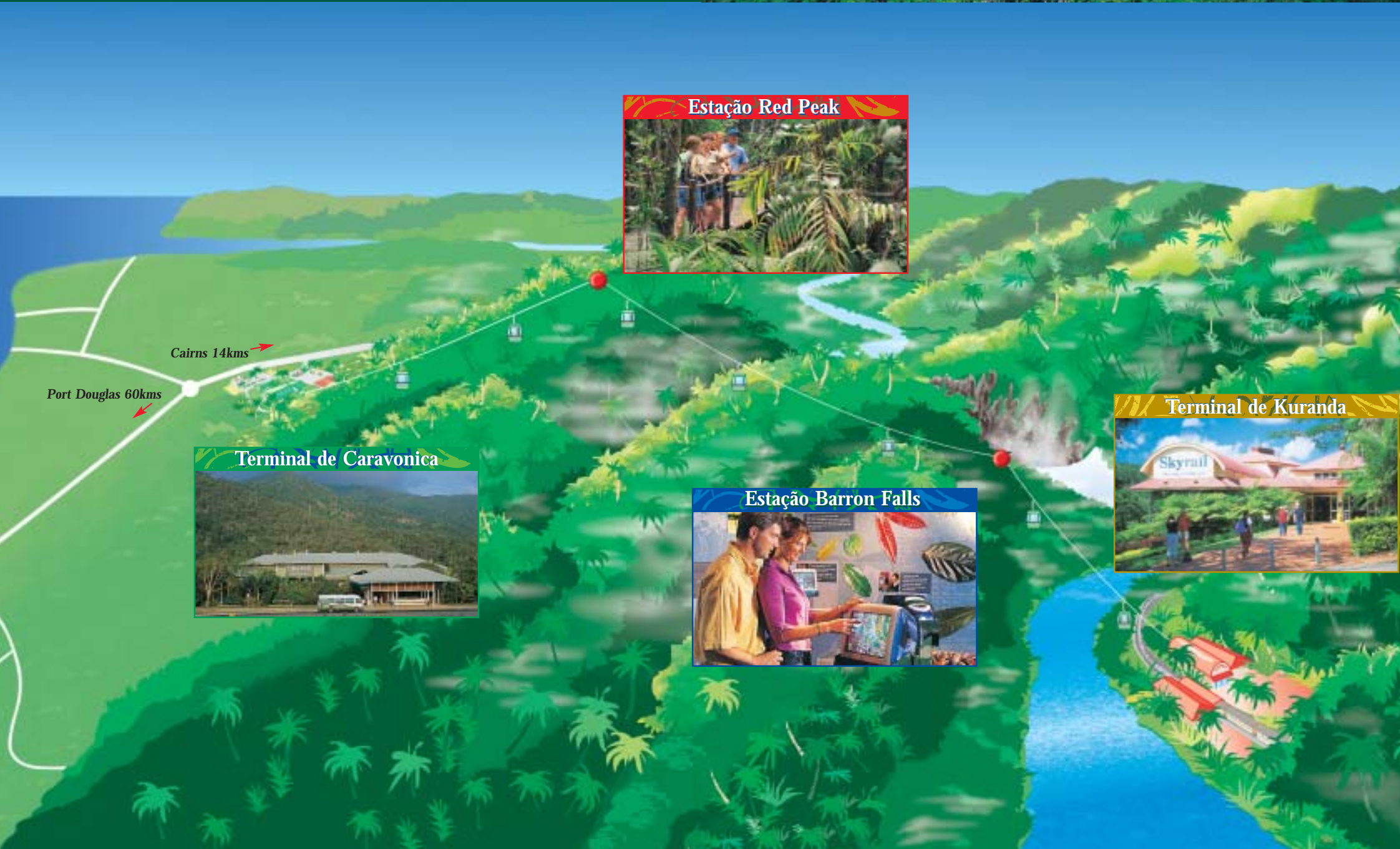
Estação Red Peak